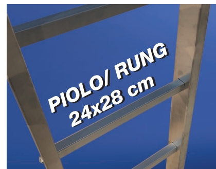
GRADINI PIOLI / RUNGS