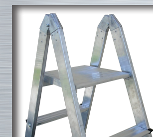
Piattaforma ribaltabile Folding platform